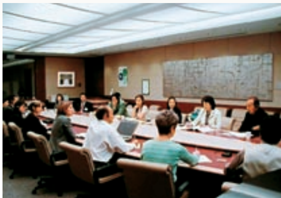
ADACメンバーとアルティコア社ニュートリライト研究者との企画会議(2004年)

製品の開発にあたっては、各国の法規に合わせ使用できる成分や容量を調整したり、味、サイズ、容器のデザインなどを慎重に検討し、主成分やコンセプトは同じでも、細かい部分を微妙に変えています。その代表的な製品はトリプルX(他